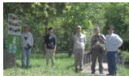
【生態園での環境学習会】

具体的にはユキヤナギやダイオウグミ等を植えテントウムシ、カマキリ、クモ等を保全することにより、メジロ、ジョウビタキ、ツグミ、コゲラ等の鳥類も飛来するようになりました。