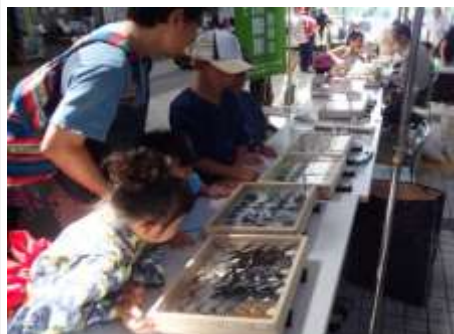
【夏の展示会（県民活動総合センター）】

「自然環境観察会」は、都市近郊において生き物を観察し自然環境の保全に寄与することを目的としています。都内のNPOが主催する自然観察会で知り合ったメンバーが、2012年に地元埼玉でも活動を行うため